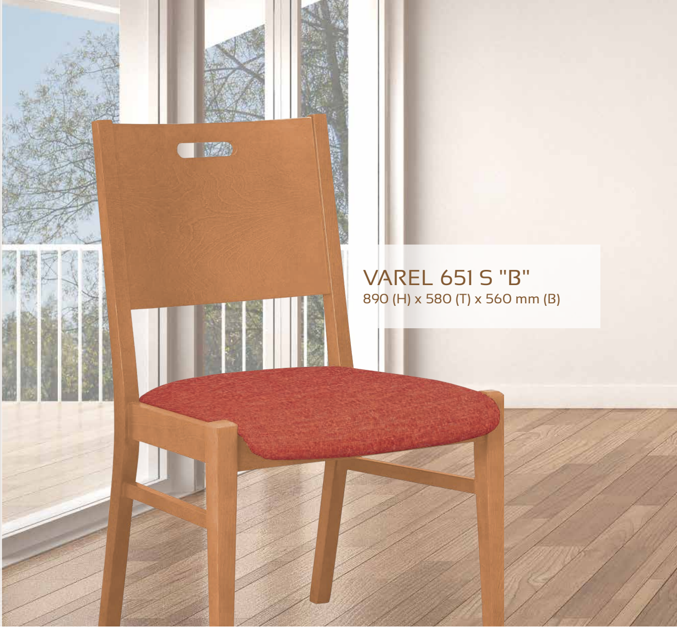
VAREL 651 S "B" 890 (H) x 580 (T) x 560 mm (B)