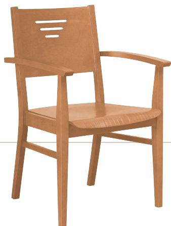
VAREL 652 AS "C" 890 (H) x 580 (T) x 560 mm (B) Abbildung mit Lehne C