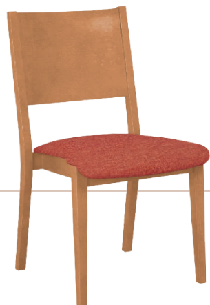
VAREL 651 ST "A" 890 (H) x 580 (T) x 500 mm (B) Abbildung mit Lehne A