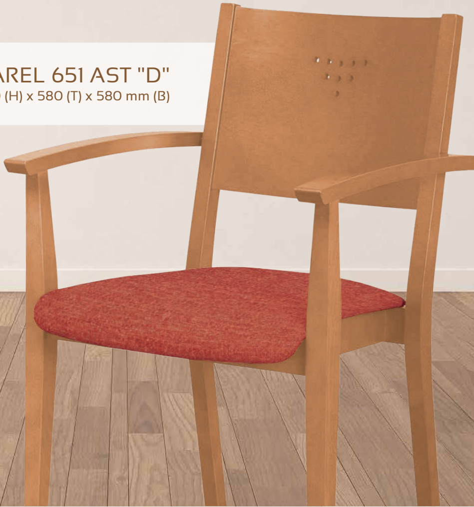
VAREL 651 AST "D" 890 (H) x 580 (T) x 580 mm (B)