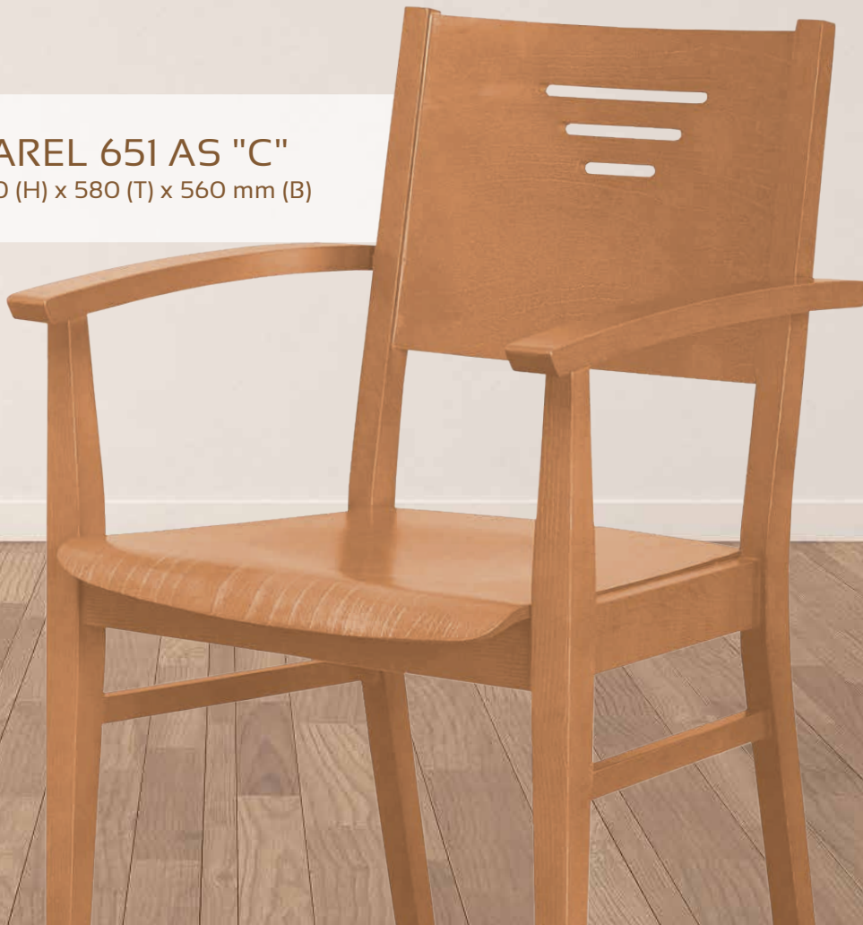
VAREL 651 AS "C" 890 (H) x 580 (T) x 560 mm (B)