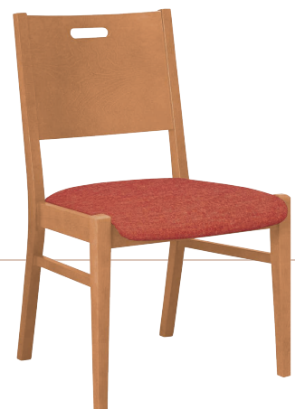
VAREL 651 S "B" 890 (H) x 580 (T) x 560 mm (B) Abbildung mit Lehne B