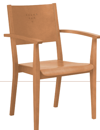
VAREL 652 AST "D" 890 (H) x 580 (T) x 580 mm (B) Abbildung mit Lehne D