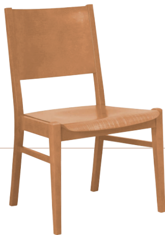
VAREL 652 S "A" 890 (H) x 580 (T) x 560 mm (B) Abbildung mit Lehne A