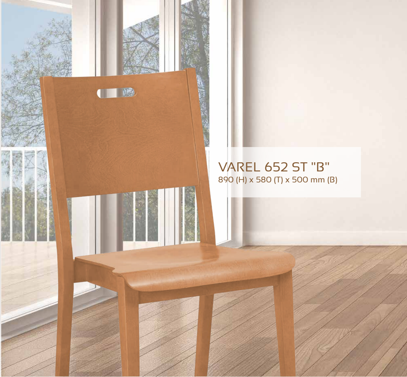
VAREL 652 ST "B" 890 (H) x 580 (T) x 500 mm (B)